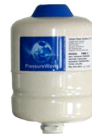
Press Tank 2lt Code: 481500002 netto prijs: €14.25

De Plug&GO ® pomp heeft een innovatieve procedure ter voorkoming van waterlekken in het ledingsysteem. Indien de pomp meer dan 500 keer binnen de 24 uur opstart dan zal de motor automatisch in een "slaapstand" komen. Deze procedure zal oneindig herhaald worden totdat het lek gerepareerd is en de pomp terug normaal kan werken. De pomp kan alleen gereset worden door de voedingsschakelaar AAN / UIT te gebruiken of door de stekker uit te trekken. Indien het lek niet gestopt kan worden en de pomp daardoor te veel starts/stops maakt, wordt aangeraden om een klein drukvat te plaatsen.